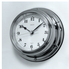
「マリン・クロック」(1979)